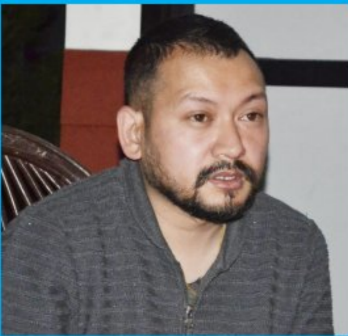
सगुन शाक्य संचालक